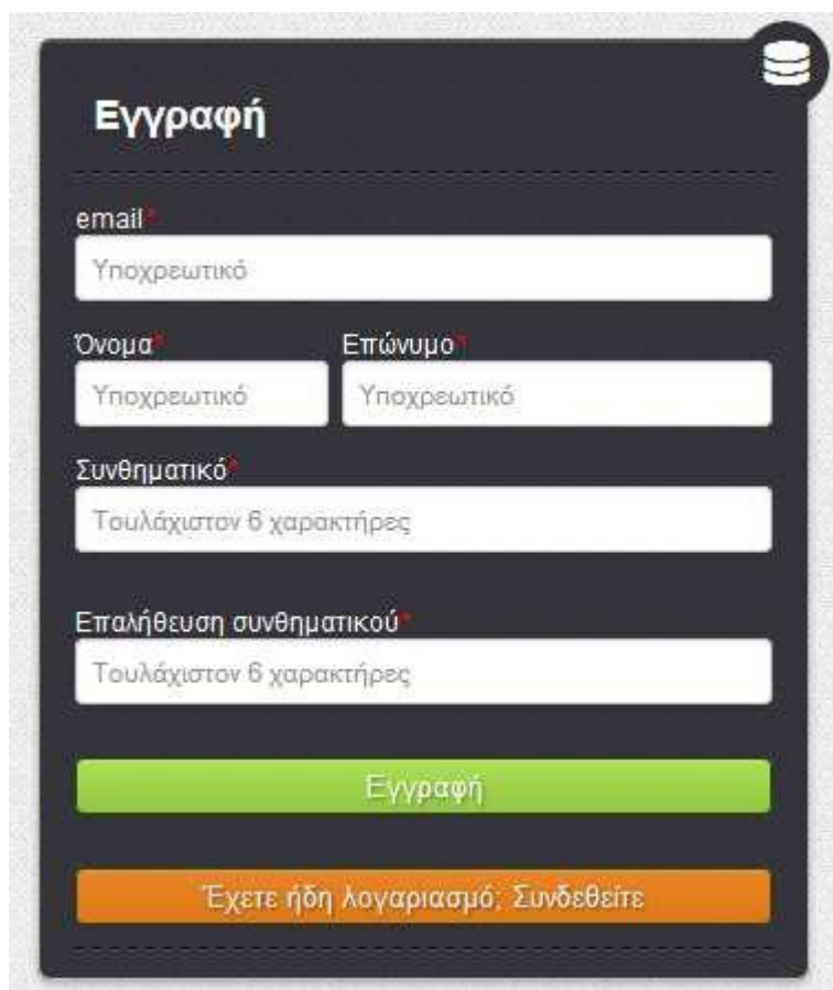
Εικόνα 2. Φόρμα εγγραφής στο σύστημα

Από την αρχική σελίδα, για να κάνουμε εγγραφή, θα πρέπει να επιλέξουμε το πορτοκαλί κουμπί με τίτλο «Εγγραφή στο σύστημα». Θα προκύψει η παρακάτω φόρμα: